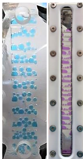
Fig. 2. Photographies des milli-colonnes pulsées en fonctionnement (a) Prototype gravé dans du PMMA (b) Prototype avec garnissages amovibles