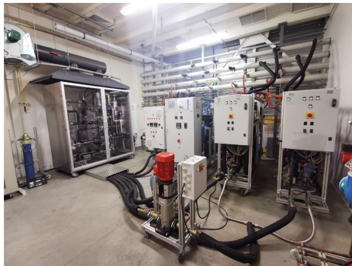
Figure 2 : Machine de froid GAX FRIENDSHIP installée sur le banc d'essai CEA INES

Les essais expérimentaux ont permis d'évaluer les performances de la machine en régime stabilisé à différentes températures de fonctionnement et de voir son comportement en régime dynamique. À -5^{\circ}\text{C} , le prototype fournit près de 11kW