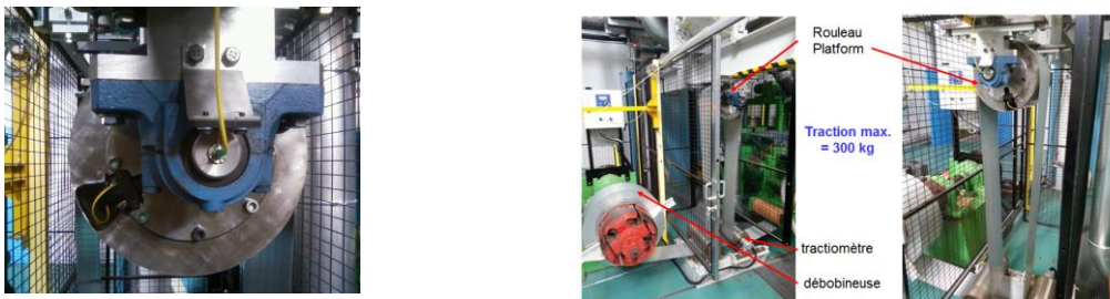
Fig. 1 : Vue du stressomètre à fibres optiques mis au point par le CEA LIST et ARCELOR-MITTAL (gauche) et insertion dans un circuit de défilement de bande (AM R&D, droite).

Un premier étalonnage en effort est réalisé à l'aide d'une presse et d'un capteur d'effort (sensibilité ~ 50 à 60 \mu\text{m}/\text{N} ). Un second étalonnage statique en pression est réalisé sur pilote de défilement de bande (Fig. 1 – droite). Les sensibilités obtenues sont de l'ordre de 6 à 13 \mu\text{m}/\text{m.kPa} . La performance de détection est évaluée par un critère de « capabilité » C = 0,25 \cdot \sigma_m / \sigma_c où \sigma_m et \sigma_c sont respectivement l'incertitude recherchée sur la mesure de planéité (5 UI) et l'incertitude sur la mesure différentielle (~ 4 \mu\text{m}/\text{m} ). Pour une bande d'acier de 0,1 mm, ce critère est de l'ordre de 3, proche de ceux des meilleurs dispositifs commerciaux. En rotation, le signal optique est extrait à l'aide d'un joint tournant optique monomode (Princetel MJXA-155) connecté sur l'un des paliers. La pression dans le contact est déduite par soustraction d'un premier signal obtenu lorsque la bande est en contact avec un second signal de référence acquis lorsque la bande est hors contact. La compensation en température est ainsi obtenue naturellement lors de la rotation du rouleau.