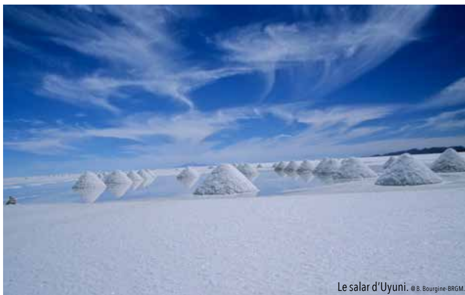
Le salar d'Uyuni.

Toutefois, les limites d'un tel exercice sont évidentes. La date d'épuisement reste une notion théorique, et sa prise en considération ne dispense pas d'un examen plus précis.