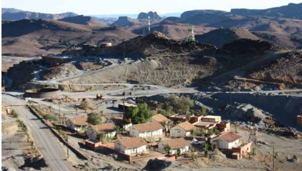
Mine de Bou Azzer, Maroc, seule mine de cobalt en produit principal.

effets en sont contradictoires. D'un côté, c'est une façon d'exercer une pression sur l'offre disponible et tirer de nouveau à la hausse les prix. D'un autre, elle peut accélérer les initiatives de compagnies minières juniors visant à développer de nouveaux projets, favoriser la reprise d'autres productions et encourager les acteurs du recyclage de batteries Li-ion.