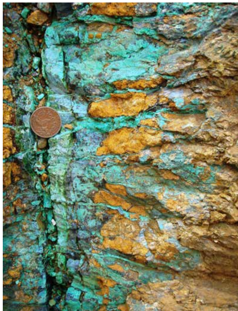
Garnierite, minéral de nickel en Nouvelle Calédonie.

Le premier facteur à prendre en compte est celui de l'augmentation probable des réserves de cobalt mondial à moyen terme, suite à un nouveau cycle