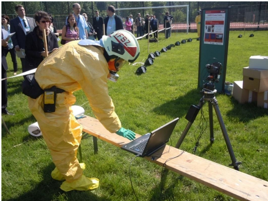
Fig. 1 : Utilisation de la gamma-caméra par un pompier hongrois lors de l'exercice de démonstration le 16 mai 2013 à Budapest

L'évaluation radiologique de la zone est effectuée de façon automatique par les équipes de premiers secours lors de la gestion et l'évacuation des victimes. Plusieurs dispositifs Canberra (radiamètres \alpha\beta\gamma X se portant à la ceinture, spectromètre portable) permettent une mesure du débit de dose à intervalles réguliers et l'identification des radioéléments présents, au cours des déplacements des équipes de premiers de secours et transmettent automatiquement ces informations avec la position GPS, ce qui permet de constituer rapidement une carte radiologique de la zone et de définir un périmètre d'exclusion si nécessaire. Une caméra gamma portable (moins de 2 kg), conçue par le CEA LIST et Canberra, permet de localiser les points chauds grâce à la superposition des images radiologique et optique.