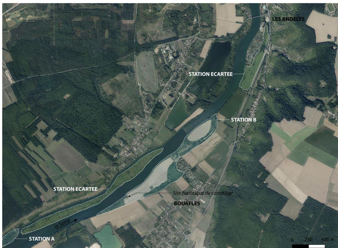
Figure 7. Plan de situation des zones explorées autour de Bouafles, aval Seine.

Les carottages ont été réalisés à l'aide d'un carottier russe en inox. Cette méthode offre l'avantage de très peu perturber les séquences sédimentaires, en particulier en évitant le phénomène de compaction lié à l'introduction des liners dans les sédiments. Les différents niveaux sédimentaires sont ainsi prélevés selon leurs profondeurs réelles au sein de l'environnement de dépôt. D'autre part, le carottier russe donne accès aux enregistrements sédimentaires directement après sa remontée. Cela permet de contrôler la qualité du carottage en temps réel et de multiplier les prises afin de disposer des quantités de matière nécessaires à l'ensemble des analyses. Enfin, l'inox du carottier évite les contaminations en matériaux plastiques qui peuvent avoir lieu en utilisant des liners en PVC-U adaptés au carottier UWITEC et à percussion. L'inconvénient majeur de cette technique de carottage est de ne pas conserver les enregistrements qui sont directement échantillonnés sur site.