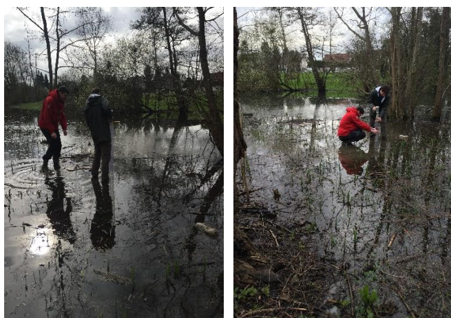
Figure 4. Prélèvements de carottes (le 4 mars 2020 à Boissise-le-Roi). A gauche : 77-BOI-0 ; à droite : 77-BOI-03.

La carotte 77-BOI-02, mesurant 50 cm, est prélevée avec un tube en polycarbonate de diamètre 9 cm à l'endroit du premier carottage 77-BOI-01 repéré grâce aux arbres (Figure 4 à gauche). Une seconde carotte est prélevée en s'avançant d'un mètre en s'éloignant de la berge. La carotte 77-BOI-03 mesure 80 cm (Figure 4 à droite). Le tube en polycarbonate est enfoncé manuellement. Des difficultés à ressortir le tube du sol souple et gorgé d'eau sont observées.