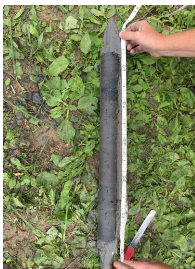
Figure 8. Photo d'une partie de la carotte prélevée dans la zone B (Fig. 7) autour de Bouafles, vers Les Andelys (10 juillet 2020).

Les carottages ont été réalisés à l'aide d'un carottier russe en inox. Cette méthode offre l'avantage de très peu perturber les séquences sédimentaires, en particulier en évitant le phénomène de compaction lié à l'introduction des liners dans les sédiments. Les différents niveaux sédimentaires sont ainsi prélevés selon leurs profondeurs réelles au sein de l'environnement de dépôt. D'autre part, le carottier russe donne accès aux enregistrements sédimentaires directement après sa remontée. Cela permet de contrôler la qualité du carottage en temps réel et de multiplier les prises afin de disposer des quantités de matière nécessaires à l'ensemble des analyses. Enfin, l'inox du carottier évite les contaminations en matériaux plastiques qui peuvent avoir lieu en utilisant des liners en PVC-U adaptés au carottier UWITEC et à percussion. L'inconvénient majeur de cette technique de carottage est de ne pas conserver les enregistrements qui sont directement échantillonnés sur site.