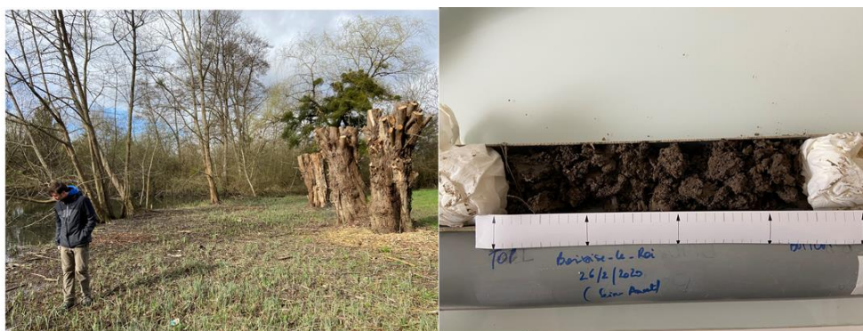
Figure 3. Site de carottage à Boissise-le-Roi et carotte 77-BOI-01 (26 février 2020).