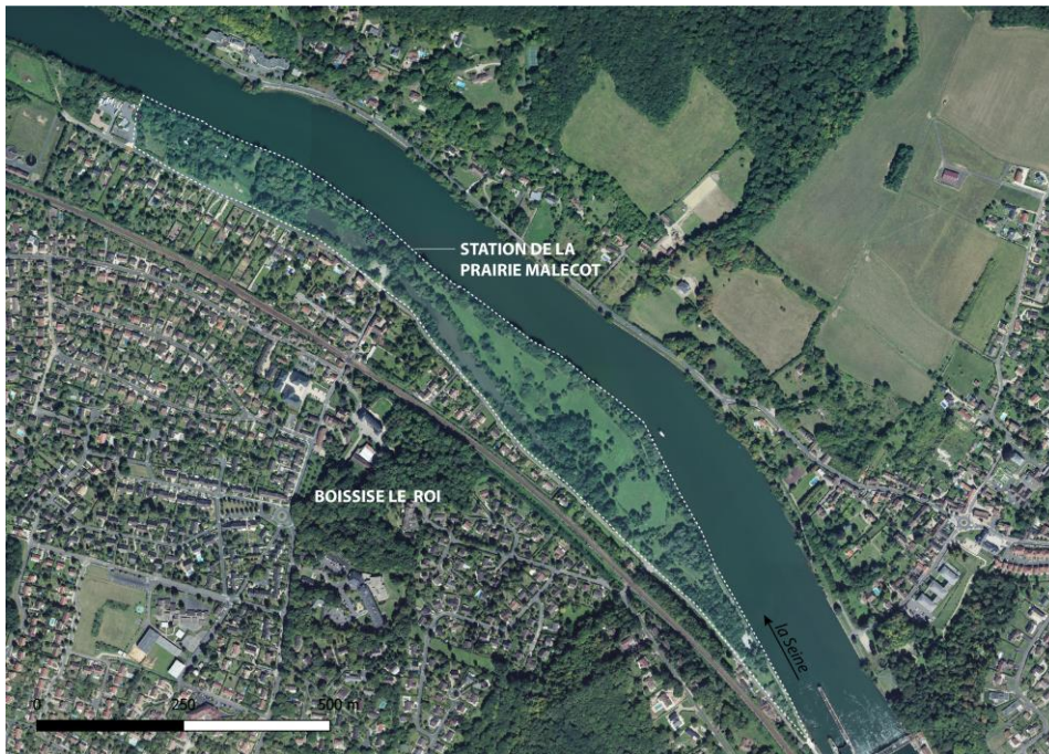
Figure 2. Plan de situation du site de la prairie Malécot.

En 1992, sous la houlette du Département de Seine-et-Marne, l'espace naturel sensible de la prairie Malécot est créé puis étendu en 1993, afin de garantir le maintien d'un site préservé en bordure de Seine, à proximité du centre ancien de Boissise-le-Roi. Ce site périurbain, associé à la vallée de la Seine, fait partie de la Réserve de Biosphère de Fontainebleau et du Gâtinais, classée par l'UNESCO au patrimoine mondial des sites naturels en novembre 1998. Situé au nord-est de Boissise-le-Roi, sur le Plateau de la Brie, il s'étend en rive gauche de la Seine sur un peu plus d'un kilomètre. Les plans du XV ème et du XVIII ème siècles représentent la prairie Malécot comme une île. Ce n'est que sur le cadastre napoléonien, datant du XIX ème siècle, qu'elle apparaît sous sa forme contemporaine. Le site comprend une prairie d'environ quatre hectares située entre le fleuve et l'étang (Fig. 2). Ce dernier est alimenté par le ru de la mare aux Evées, provenant d'un bassin artificiel. De plus, une buse, probablement en hautes eaux, connecte la Seine et l'étang. Aménagée au XIX ème siècle, afin d'assécher cette vaste zone marécageuse, la prairie Malécot constitue une zone humide particulièrement intéressante en termes d'expansion des crues, d'épuration des eaux de ruissellement ou encore d'habitat naturel. Une partie de la prairie est pâturée, le reste étant géré avec parcimonie pour préserver la faune et la flore.