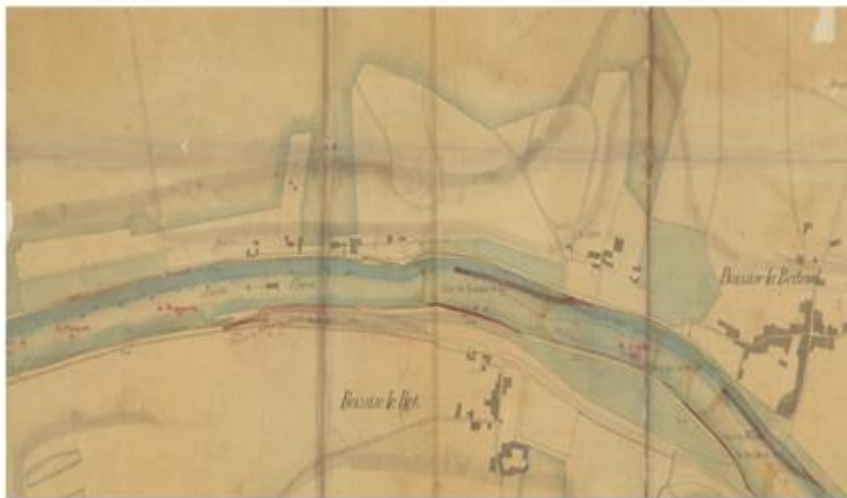
Figure 1. Beaulieu vers 1840, avant travaux sur la Seine. carte probablement de la main de l'ingénieur Chanoine (vers 1840)

Le site de la prairie Malécot, situé sur la commune de Boissise-le-Roi, repéré grâce au travail cartographique entrepris en 2011 au sein du PIREN-Seine (Alexandre, 2012, Lestel et al, 2019), est situé en aval de Melun. La prairie de Malécot semble déjà rattachée aux berges avant la carte d'Etat-Major de 1840 et celle réalisée avant travaux datant de la même période (Figure 1). Le site de la prairie Malécot fait face au lieu-dit Beaulieu, sur la commune de Boissise-la-Bertrand en rive droite.