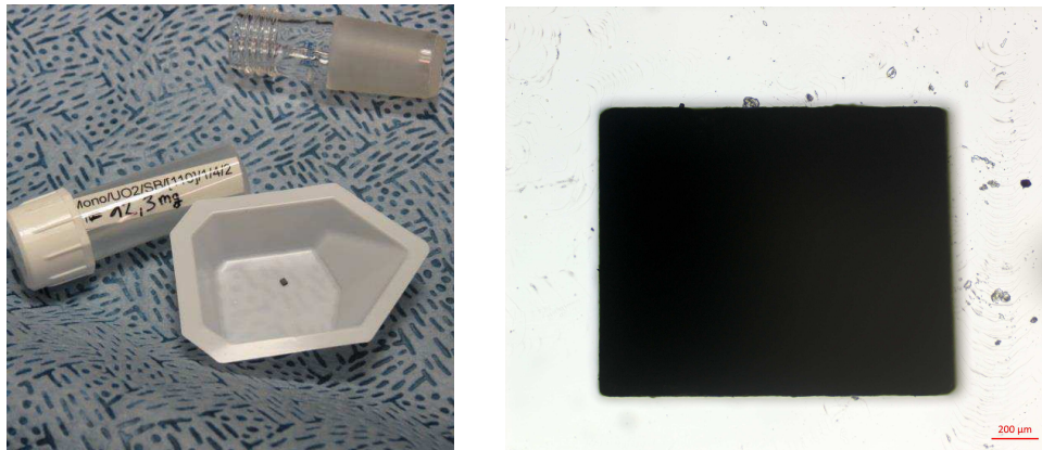
Figure 1 : Echantillon monocristallin et cellule de dissolution en quartz.

meilleure compréhension de l'impact des paramètres liés au solide sur la vitesse de dissolution en vue de la modélisation des phénomènes siégeant à l'interface solide/solution de l' \text{UO}_2 monocristallin en milieu nitrique.