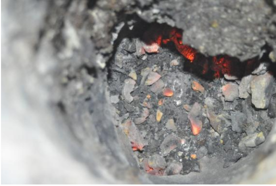
Figura 7a. Plomo en el fondo de la wayra 2.