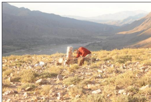
Figura 5. Wayra 1 en funcionamiento.

Wayras 4, 6 y 7: se trata de la misma wayra utilizada tres veces. Como resultado de la operación precedente se pudo constatar que la supresión del primer rango de orificios de ventilación tuvo como consecuencia la