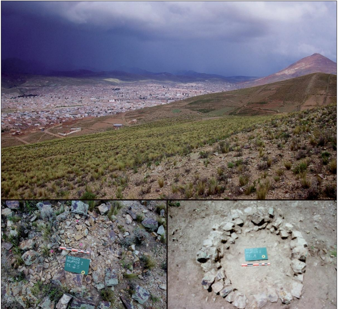
Figura 3. Sitio Juku Huachana, Potosí. Fotografías del sitio (fondo: ciudad de Potosí y Cerro Rico), y de estructuras asociadas con la fundición con wayras.

muestran una significativa presencia de cobre. Un aspecto significativo, pero que no resulta suficiente como para afirmar que fueron utilizadas exclusivamente para el procesamiento de este mineral. El segundo sitio, ubicado a 15 km al este de la localidad de Uyuni (Antonio Quijarro, Potosí), es un importante establecimiento metalúrgico prehispánico cuya cronología multicomponente se extiende entre los siglos IX y XIV (Cruz 2010; Lechtman, Cruz y McFarlane 2011). Hornos del tipo wayra fueron igualmente señalados en otros sitios prehispánicos del espacio surandino, entre ellos Miño Collahuasi (Salazar, Berenguer y Vega 2013: 94)