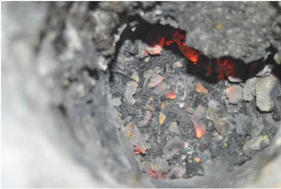
Figura 7a. Plomo en el fondo de la wayra 2.