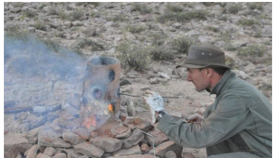
Figura 8. Wayra 4 en funcionamiento.

Prueba W1: la primera prueba fue llevada a cabo el 18/04. A las 16 hrs 30 min se procedió a llenar el horno