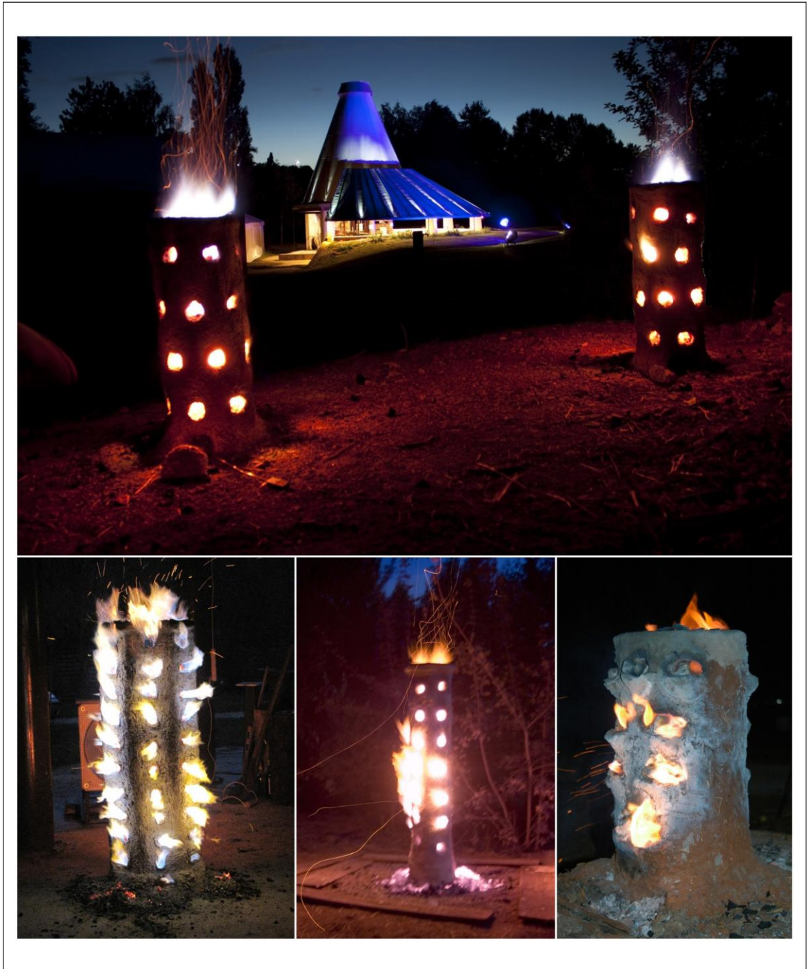
Figura 1. Diversas wayras experimentales elaboradas en la plataforma experimental de Melle (Francia).