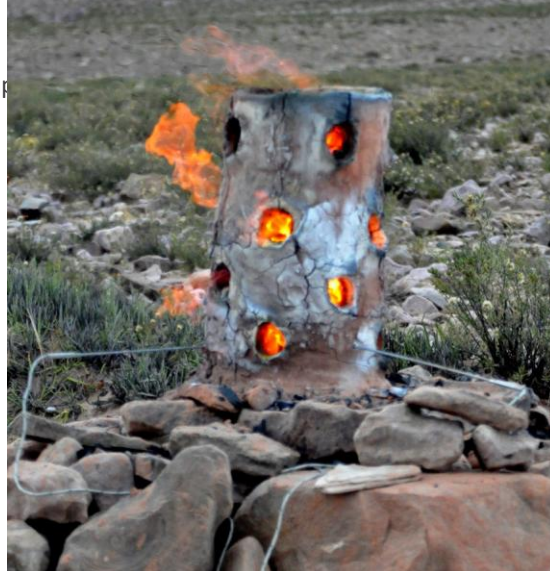
Figura 11. Wayra 7 en funcionamiento con las sondas termocuplas insertadas.

Prueba W2: la prueba W2 fue desarrollada conjuntamente con la prueba W3 el día 20/04. Como la anterior, la puesta en marcha tuvo lugar por la tarde a las 16 hrs 30, produciéndose desprendimientos solamente en la pared externa del horno. Las cargas de mineral fueron calibradas en un 1 kg con una granulometría tipo grano de café (Figura 6). Bajo un viento dominante de 6 m/seg se introdujo la primera carga a las 17 hrs 30 y las dos otras en intervalos de 10 minutos, constatando la formación de gotas gruesas de plomo cayendo sobre los carbones. La operación fue concluida a las 19 hrs. Después de abrir el horno se constató en el fondo una gran cantidad de gotas de plomo no aglomeradas (403 gr) y una masa de plomo en estado líquido (91 g) (Figuras 7a y 7b). Se notó igualmente un puente de escoria formado sobre la base de la primera línea de orificios de ventilación. Finalmente, se pudo observar en los carbones inferiores la presencia de mineral poco transformado, así como una escoria cristalizada de coloración gris verdicina. Prueba W3: el reactor de la prueba W3 fue idéntico al de la prueba W2, y funcionaron simultáneamente presentan-