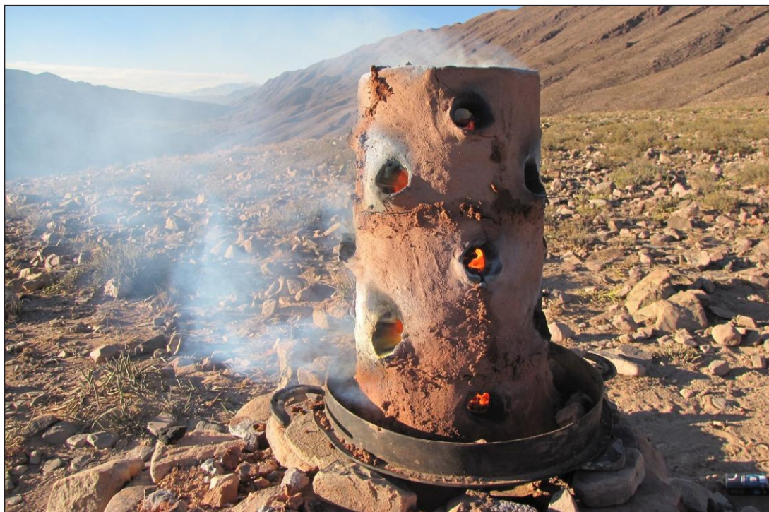
Figura 12. Wayra 8 (construida sobre plataforma de hierro) en funcionamiento.

se depositó a las 17 hrs 20 una carga de mineral de 1 kg, teniendo en ese momento temperaturas de 930 y 400 °C. Se pudo constatar, por los orificios de ventilación expuestos al viento, la formación de gotas gruesas de plomo, así como el comienzo del proceso de escorificación de la pared. La reacción fue muy rápida, y a las 17 hrs 30 se procedió al depósito de la segunda carga bajo temperaturas de 913 °C y 500 °C. La última carga fue depositada a las 17 hrs 45 con 950 °C y 480 °C de temperatura. Entre cada carga se llenó la columna del horno con carbón a fin de favorecer tanto la reacción como el mantenimiento de la temperatura. La prueba concluyó a las 19 hrs, recuperando del fondo del horno una pequeña concentración de plomo (14 gr) y un producto plomífero (93,4 gr). De la misma manera que las pruebas anteriores, un puente con escoria comenzó a formarse bajo la primera línea de orificios expuestos al viento. Prueba W5: se trató de una prueba única ya que el reactor fue construido con piedras unidas con argamasa de arcilla (Figura 9), razón por la cual se decidió no instrumentar el horno. Las fuerzas del viento fueron idénticas a la prueba W4 dado que los dos hornos funcionaron de manera simultánea. La carga de 3 kg fue repartida en tres