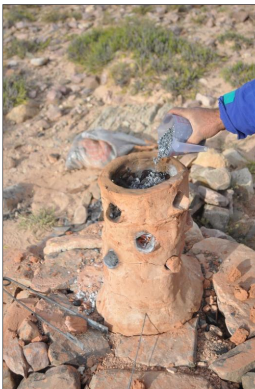
Figura 6. Carga de mineral en la wayra 2.

ampliación de un espacio con temperatura inferior a la necesaria. Por tal razón se retomó el modelo de la wayra 1. A fin de limitar la zona fría, y sobre la base del funcionamiento de los hornos precedentes, se implementó una corona de piedras en la base que limitó la cantidad de arcilla utilizada. Una menor cantidad de arcilla significa una menor cantidad de evaporación de agua. La wayra 4 fue construida el día anterior a su utilización y contó con