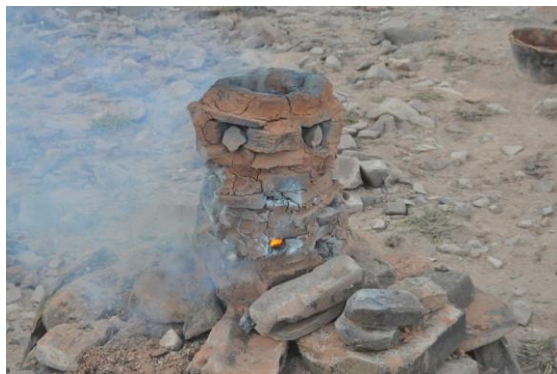
Figura 9. Wayra de piedra (W5) en funcionamiento.