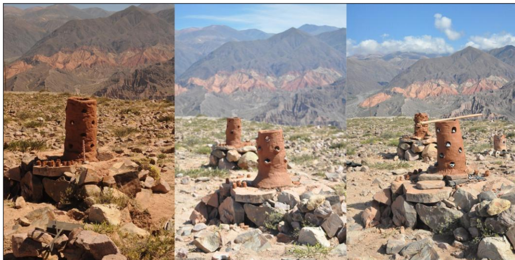
Figura 4. Wayras 1, 2 y 3

viento, un aspecto central que influyó en la calidad de los resultados obtenidos. En contraposición, la dirección aleatoria del viento no impactó negativamente en la experiencia dado que, visiblemente, este tipo de horno fue concebido tomando en cuenta esta variable, razón por la cual presentan orificios de ventilación sobre toda la superficie de la columna de reducción.