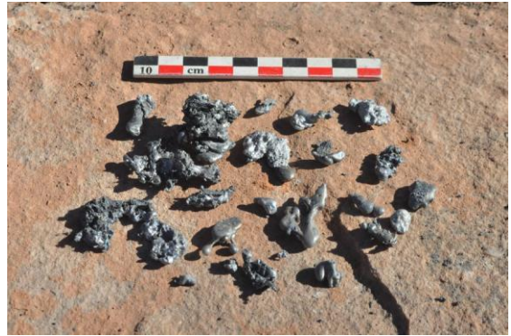
Figura 7b. Plomo recuperado en wayra 2

el mismo tiempo y proceso de secado que W2 y W3. Una segunda sonda con termocupla fue colocada en el mismo nivel que la primera, pero en el lado opuesto, en contra-viento, a fin de apreciar el gradiente térmico del interior del horno, a 10 cm del fondo.