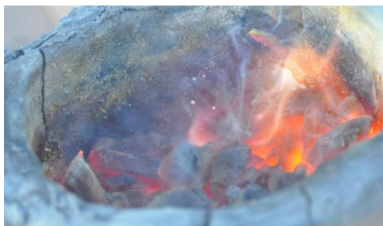
Figura 10. Formación de plomo en el borde de la columna de reducción de la wayra 6